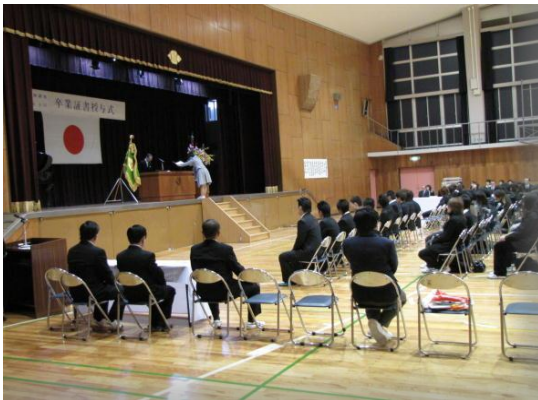
【感動の卒業式 みんなよくがんばりました】