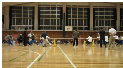
【体育大会はもりあがります】