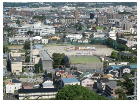
【小牧山から見た本校】