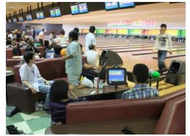
【ボウリング大会のひとつま】